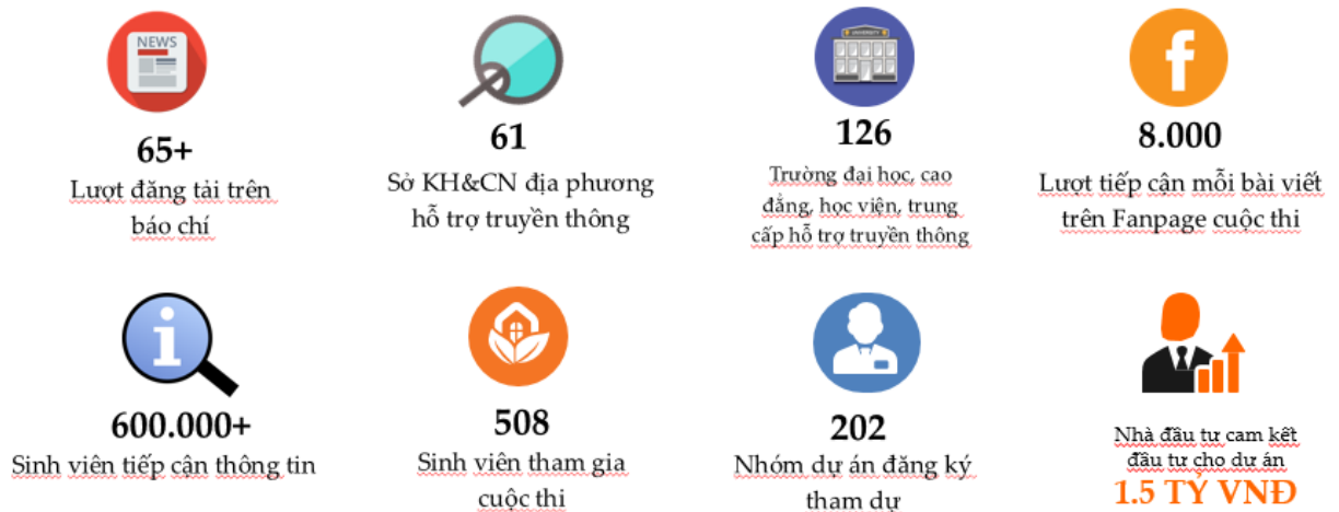
Hình 2: Các kết quả truyền thông của CiC 2019

Đồng thời, cuộc thi cũng thu hút sự quan tâm và hỗ trợ từ đông đảo các cơ quan nhà nước, tổ chức cộng đồng và các đơn vị thông tin truyền thông: