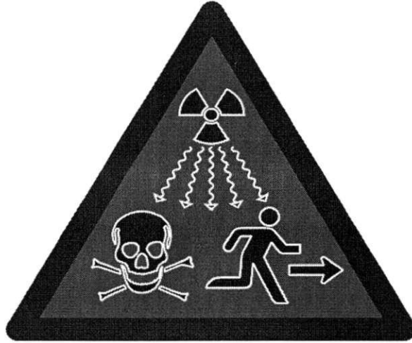
Hình 2: Dấu hiệu cảnh báo bức xạ ion hóa bổ sung sử dụng cho các nguồn phóng xạ thuộc mức an ninh A, B và C

Kích thước, màu sắc của dấu hiệu cảnh báo bức xạ ion hóa bổ sung thực hiện theo Tiêu chuẩn quốc gia TCVN 8663:2011 ISO 21482:2007